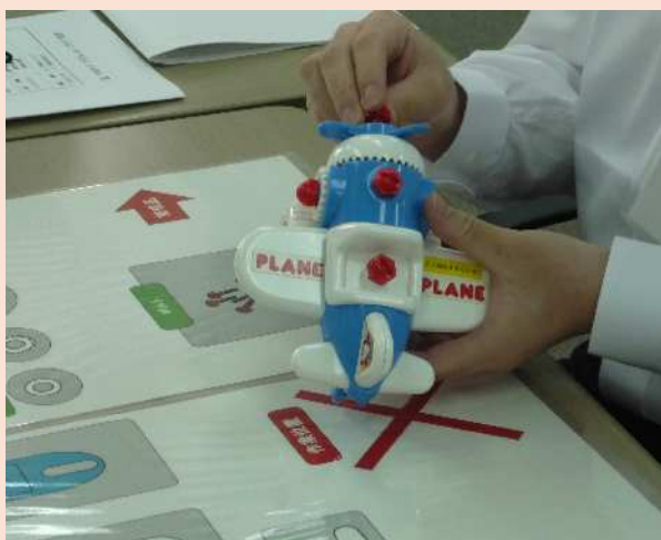
標準作業に基づく改善演習