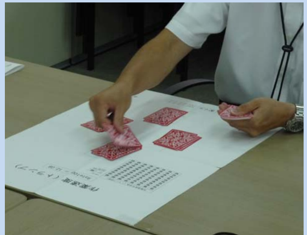
作業速度の体感演習